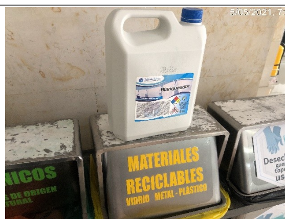
Foto 2. Ausencia de etiquetado y empackado de residuos o desechos peligrosos (envases contaminados con químicos), en punto ecológico del cuarto piso.