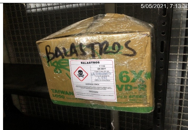
Foto 1. Etiquetado de residuos o desechos peligrosos.